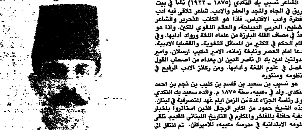
نسيب بن النكدي